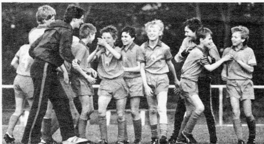
Werden die Frankfurter Jungen im Sommer wiederum Grund zum Jubeln haben? Im Mai 1986 gewannen sie als Zwölfjährige in Parchim die DFV-Spartakiade. Jetzt bereiten sie sich als AK 15 auf die XII. Kinder- und Jugendspartakiade vom 25. bis 30. Juli in Berlin vor.