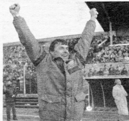
Ihre Mienen sagen alles aus: Jubelnder Jürgen Bogs, nachdenklich-enttäuschter Hans Meyer.

In der Wirkung übertrafen sie die unseres Gegners bei weitem. Neben Andreas Thom, der seine Chance konzentriert wahrnahm, hatte auch Thomas Doll gleich mehrfach einen Treffer vor den Füßen. Seine Aktivität machte dem FCK viel zu schaffen.